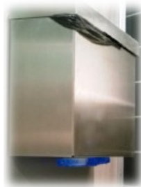
Lässt sich überall befestigen