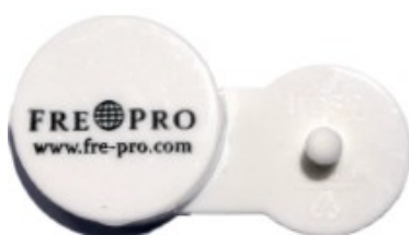
Plastikhalter mit dem doppelseitigen Klebeband