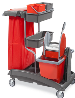
Idea Top 6

Perfekt für diejenigen, die die beste Qualität suchen.