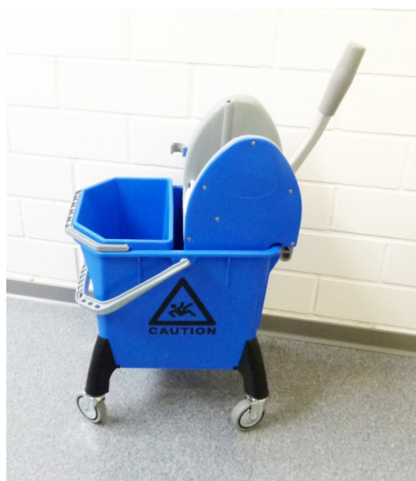
Mac 80A Einfachfahreimer 20L plus 8L mit Presse