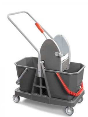
plus den Doppelfahreimer