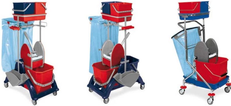
Idea Plus Gerätewagen IdeaPlus - Mac 80 - LZSM