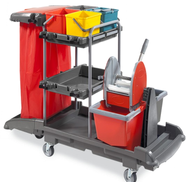
Idea Top 16 und Idea Top 21