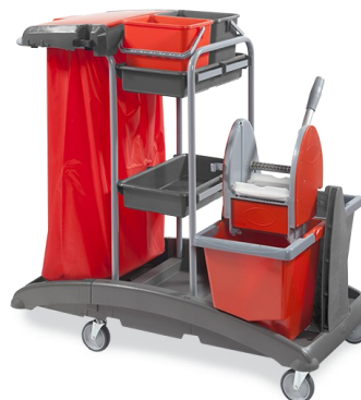
Idea Top 13